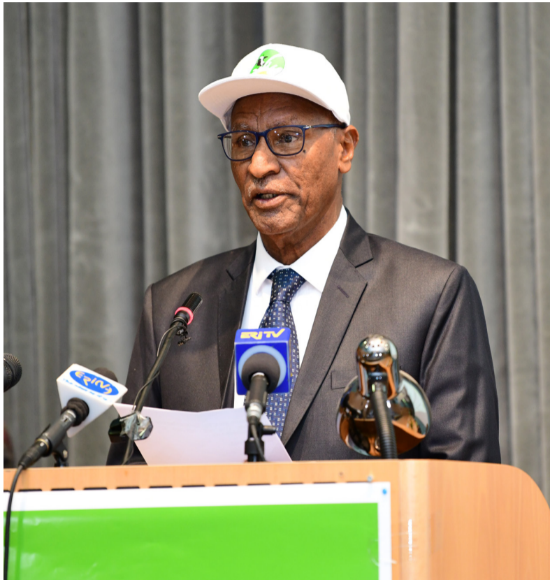
ዝርግሐን ሃልክን ዘመቐልል እዩ።

ኣብዚ ክንርድኦ ዘሎና፣ ነፍሱ-ወከፍ ቀለቤት ኣገዳሲ ምዃንን ዝኾነ ድኻም ከኣ ኣብ መላእ ኦቲ ስርዓት ዓቢ ሃሰዖ ከም ዘለዎን እዩ።