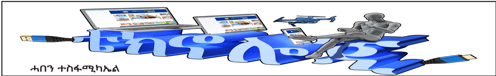
ሓበን ተስፋሚ ካኤል