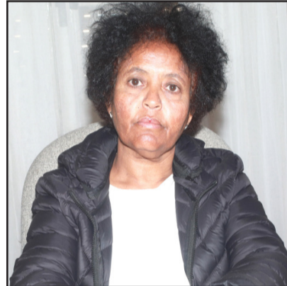
ሓቢሩ፡ ወ/ር ኣለም ኣብ መውጻእታ ተበጺሑ ዘሎ ደረጃ ምጥፋእ መሃይምነት ክዕቀብ፡ ሃሳዩ ልምድታት ብምልኣት ክውገድ፡ ሕቶ ማዕርነት ብግብራዊ ተሳታፍነት ክዓገዝ ተሓቢዖ።

ሞያዊ ትምህርቲ ብዘምልከት፡ ምስ ዝተፈለለ ናይ ግሊን መንግስትን መሻርኻቲ ትሕሳት ብምትሕብብር፡ ን91 ኣባላት ናይ ቲክኖሎጂ ኮምፕዩተር፡ ኣርትዮት ስኢል፡ ስነ-ጽባቕን ካልእን ሰልጠና ከምእተዋህበ