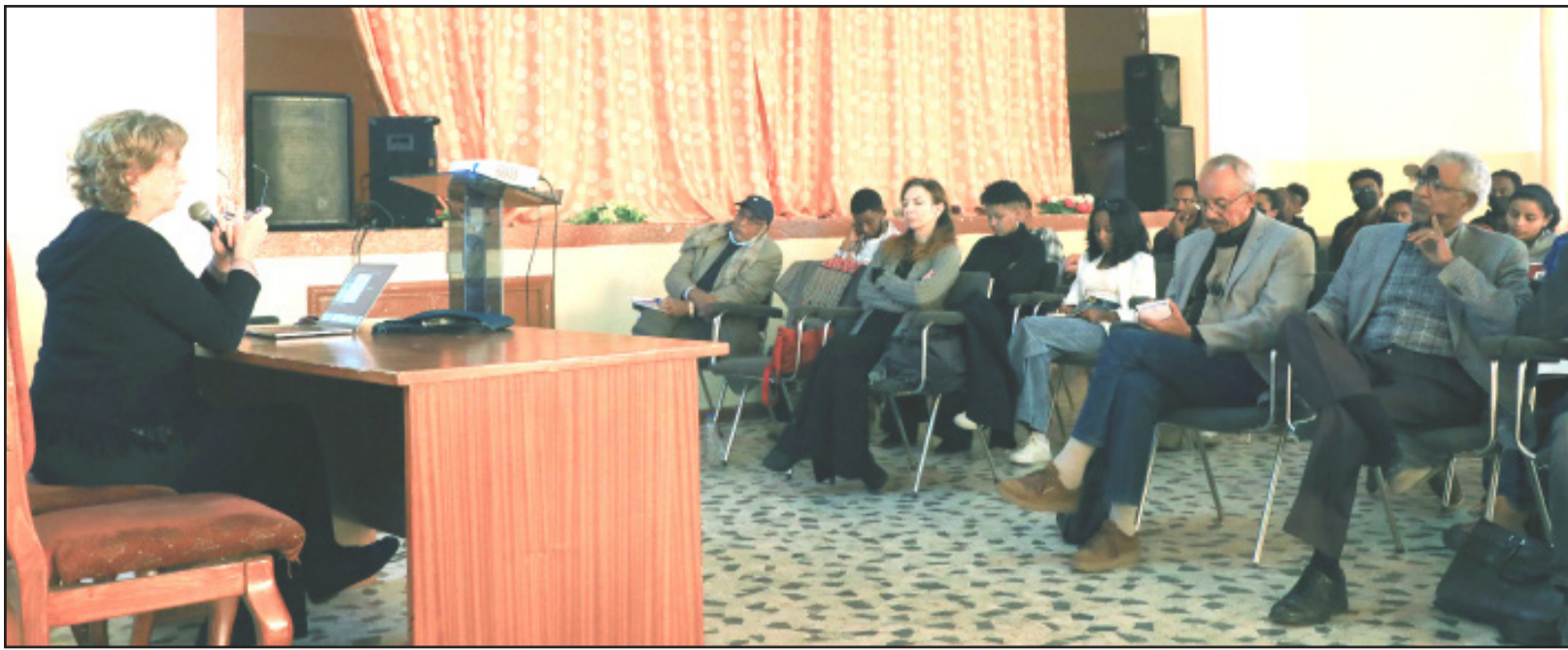
ኮሚሽን ባህልን ስፖርትን ኤርትራ፡ ብምትሕብብር ዝወደቦ - ናይ 10 ምስ ኢጣልያዊ ጉጅለ ምርምር ማዕልቲ ሰልጠና፡ ብ19 ጥቅም ተዋሂቡ።