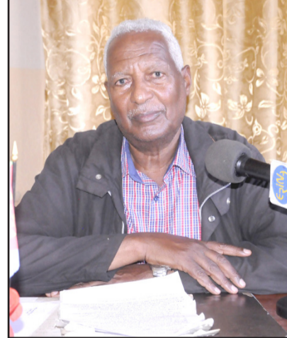
ሓደጋ ሓዊን ሳባናቲን ኣብ ዝምልከት፡ ኣብ ህይወት ሰብ ዝወረደ ጉድኣት እኳ እንተዘዩ ኣብ ንብረት ዋጋ 186 ሺሕ ናቕፋ ዕንወት ከምዘወረደ ሓቢሩ።

ሓገን ዝተረገቡ 181 ትሕሳት - 485 ሺሕ ናቕፋ፡ ባሕን ሓፊን ስጋ ክሸግ ዝተረገቡ 6 ትሕሳት - 60 ሺሕ ናቕፋ ክሸግን ንኣይ ወርሒ ክሸጉ፡ ብክህሩ ዋጋ ዝተኸሰ 8 ትሕሳት ደማ 33 ሺሕ ናቕፋ ከምእተቐጸን ገለጹ። ብዘይካ እዚ፡ 151 ኣብዮተ-ዕድሕርት ብተደለት ሚዛን 6 ብተደለት ብቐጥታ ተኸሰቡ - ኻሱ-ወከፊን 10 ሺሕ ናቕፋ ከምእተቐጸን 41 ደማ ካብ 1 ክሰብ 4 ኣዋርሕ ክሸጉ ከምእተወሰኑ ካብ ዝተፈቐደሎም ቦታ መሸጠ ወጻይም መገዳ ኣጋርን ህዘዩ ቦታን ዝጸወን ካብ ወጥን ወጻኝን ብዘይ መጽገሒ ፍቓድን ኣባይቲ ክሰርሑን ክጽግኑን ዝተረገቡን እውን ናይ ገዝብ መቐጻዕቲ ከምእተወሰኑ ኣረጋገጹ።