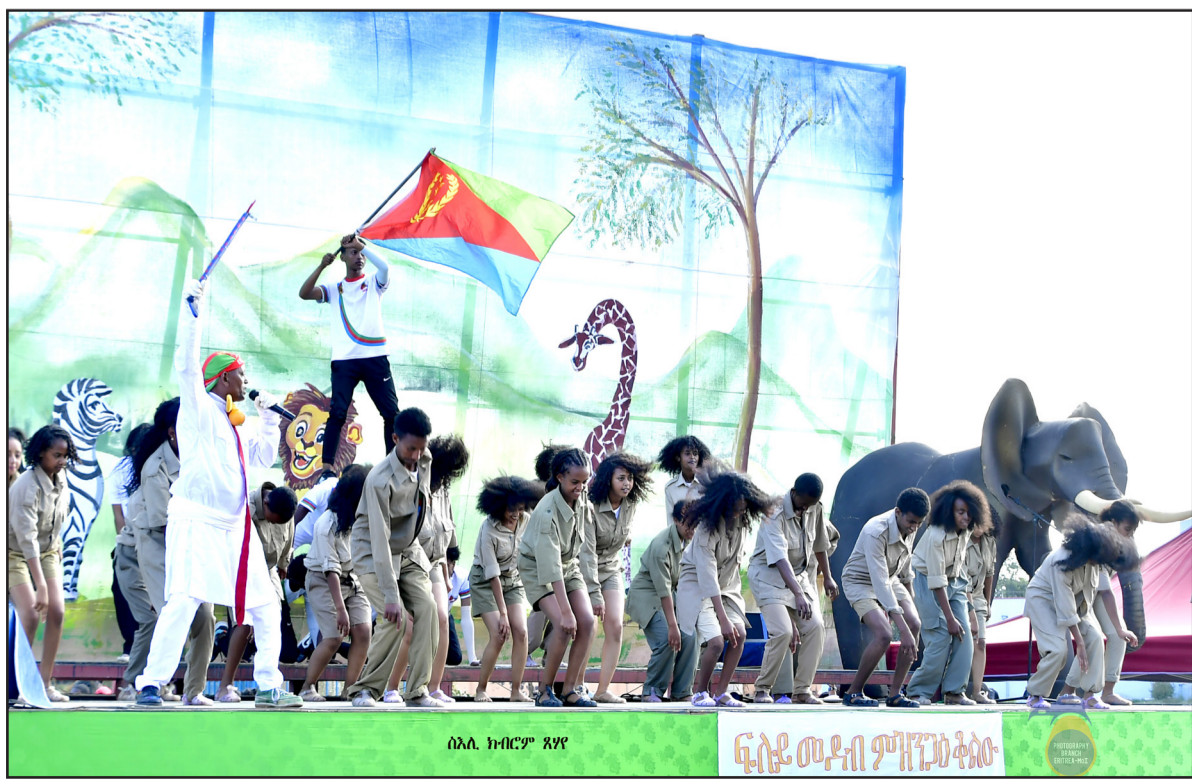
ሰላ. ክብርም ጸገዩ

አብ ከሌ!” እኛው ከሆነው ስራ ላይ ወጥን አብ ግዢ ክትትል ማህበር ደግሞ በደንብ ቀጭን ስራ ላይ ለሚሳተፉ “ውሳኔ ስራ ስራ ስራ” ማህበር አብ አረጋገጡ።