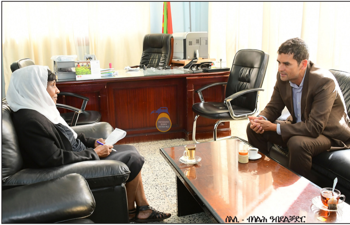
ሰኔ - ብላክ ሞሪን

ፕሮጀክት ኣላዲዎ ኣፈጠሩ ገፍሎ ልሁኝ መንግሥት ኣጣልፎ ብ24 ሰኔ ኣብ ስድስት ደሕራቸው ኣብ ኣዳራሽ ደንደን ተዋብሎ ከምዘረገገ ዝገለጸ እዩ።