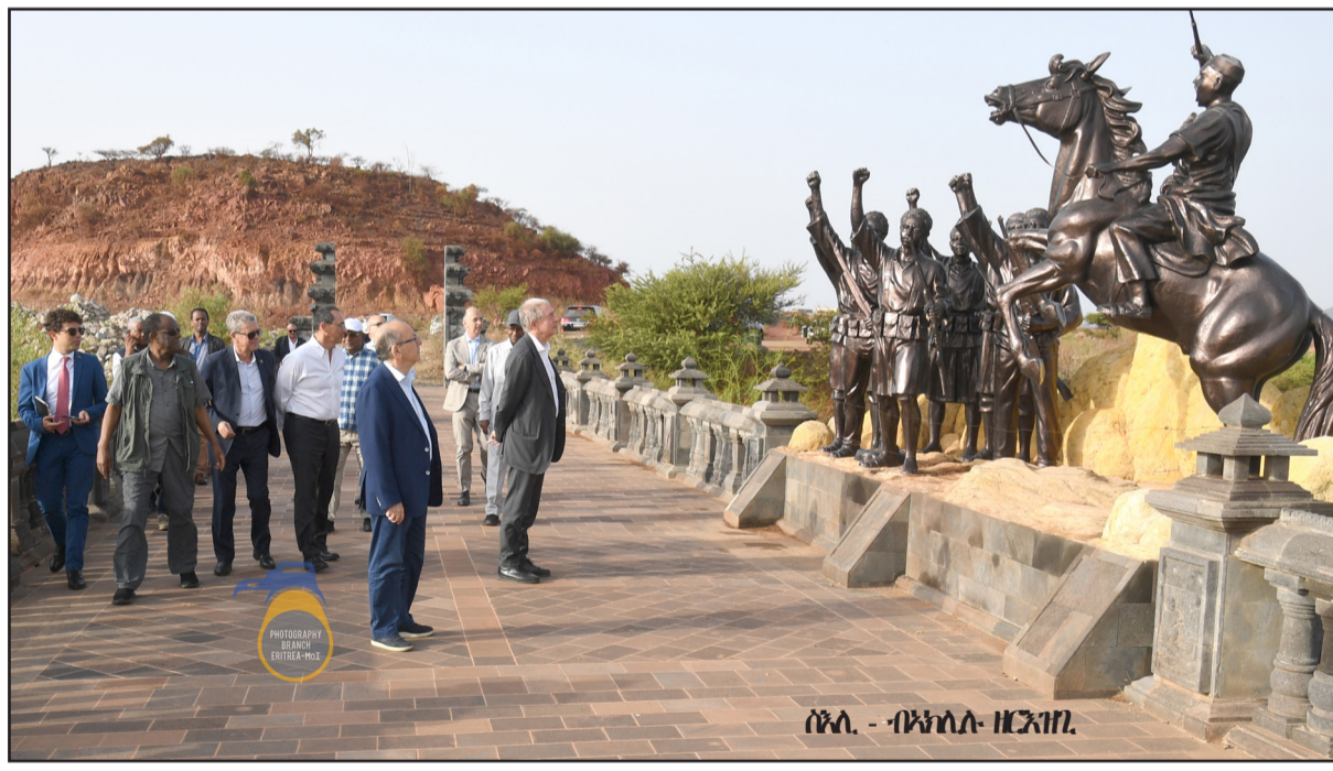
ሰኔ - ብላክ ዝርከብ