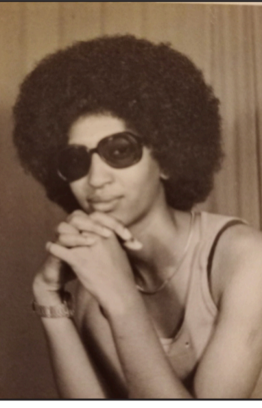
ወ/ር ገት በዩ

1977 ክልቲኦም ቀላቲ በዩ ብዘመራከ ትጽቦ ስርዓት ኣብ ከብ ኣምገራዳ ኣብ ዝርከብ ቤት ናብ ኣየርፖርት ኣምርኢ፡ ኣብ ኣዳሊ ኣብ ይኸን ኣብ ጉዕዞ ዝረጋገጥም ጸገም ውሕሳብ ክኸፍኦም ዝኸፍኡ ብራክትን መደብን ኣብቲ ተኸፍኦ ብወሳኔ ሻርራ ዝተከረሉ ቦርሳ ናይ ኣማኡራን ገትን ኣሎ፡፡ በቲ ዝተኸፍኦም ሞብ ክኣልፍ እንተ