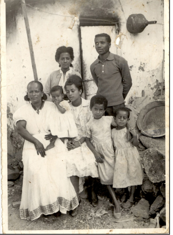
ሰድራ ባሻይ ሙብራህቲ ኣብ 50ታት

ሓደ ግዜ እውን ኣብ ከብ ፋርጃቶ ሓምሌን ስምዎ ንምጽዳም እናተኸፍኦ ከሉ፡ ሓላውታ ዝጸብጹም ናይ ጸባታ ሰባት ብቐርብ ደካታተሉም ኣሎ፡፡ ዝዚ ምስ ተረድኦ ኣብቲ ከብ ደው ኣብ ዝሰሩ መኪናን ንኣንቲ ብቐርብ ኣተኸላኣ ሓዘ መርካቶ ድሕሪ ምዕባይ ኣልኣ መኪና ቀይሩ ናብ መኻርያ ገድ ብምህራር ከም