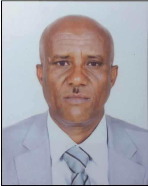
ኸይዳ፡ እቲ ኸልእ ግሎይ፡ ፍርዳቲ ዝሊ ዝሰበ ሰነ-ጥበብ ግጥምኛ፡

እቲ ኣብ ናይ ጎሚ ስታሞና ዝተሓረ - መዘቃዊ ስነ ግጥምን ጋዜጠኛውን ኣብ ስነ-ጥበብ ክህሉ ደር ዝተገልጸ