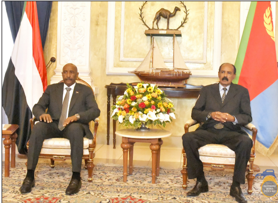
ኮምፕዩተር ኣረገጸ። አራመገሮ ልኦላዊ ባይቶ ሱዳን - ጀነራል ዓቡይ-ሐፋታሕ አልቡርሃን ኣብ