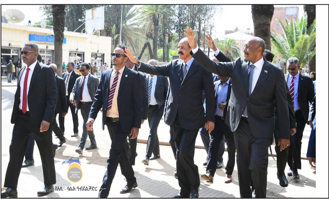
ረፋድዮ ኣሰሙ ኣትዩ። አብቲ ናይ ምቕላል ስሕርባት፡ ማህበር ጉዳይት ወጸኡ ኣቶ ዐሳምን