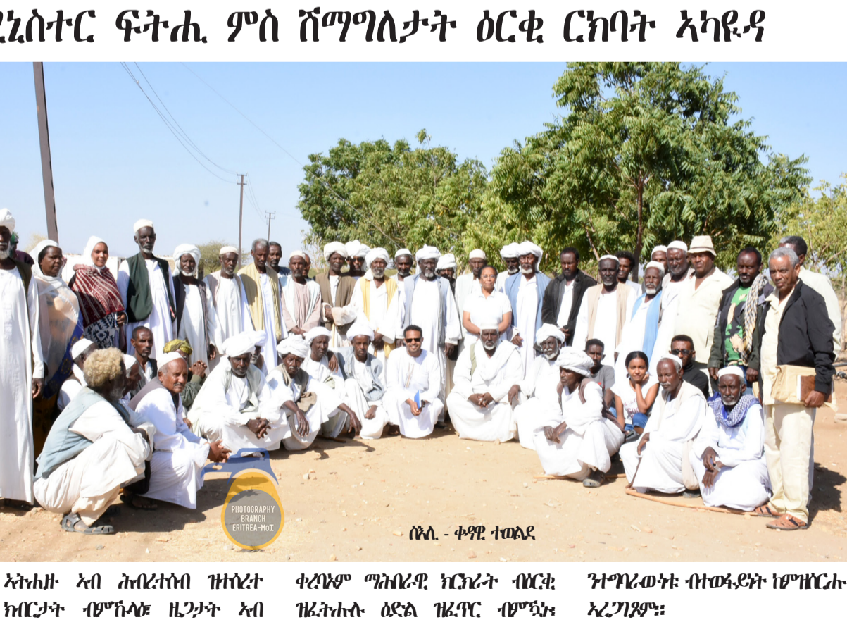
ሰሌ - ቀዳማይ ተወልደ

ጋሽ-ባርካ - ማህበራዊ ፍትሒ ምስ ስምዒታት ዕርቂ ርክብት ኣካዲዳ አብተን ካልኣት ንኡሳን ዞታት ጸሕፊታት ክቐጸል ምዃን ዝጠቐሱ ማህበር ፊወብይ ስምዒታት ስርቂ ዕማ ናይቲ መደብ ብጠየቁ ተገዳሎ። ክበርታት ሕብረተሰብ ብምቃቐ ማህበራዊ ግርጫታት ብርጅን ምርድጻን ዝደቅሱን ህበ. ክብ ዘደደሊ ሃልኪ ግዜ ገልብን ገዳዘብን ዝፍለገን ባይታ ኣብ ምፍጥር ብክግዱ ክርከቡ ኣተሓሰቡ። ተሳተፍቲ ብመገም፡ ጉዳይት ብሰማም ስርቂ ክደቅሱ ንምግር ዝተከበሰ መደብ ክቲ ክብ ሃይሕ እዮን