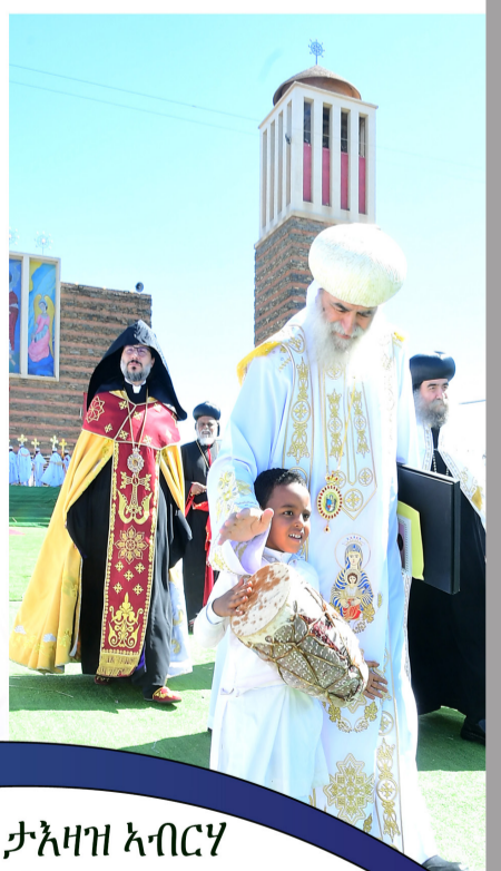
ዲዛይን - ታእዛዝ ኣብርሃ ስኢሊ- ኣክሊሉ ዘርእዝጊ ኣብርሃም በዩን