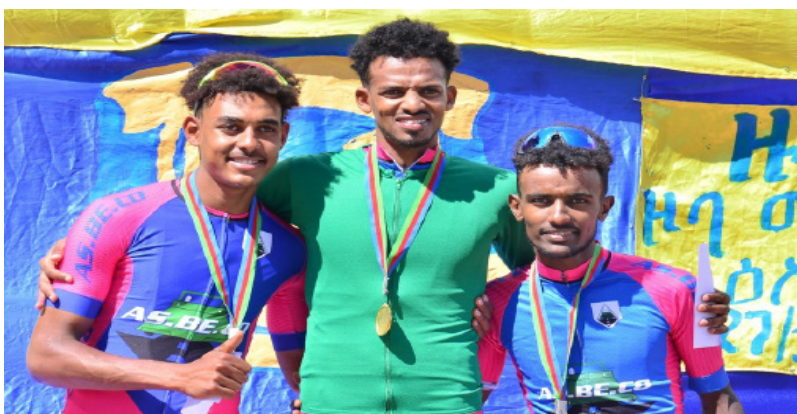
ሰለሰተ ተቐዳዳምቲ ኣሰቤት - ዕዉት ቀጠልዮ ማልዮ ነርኣትመድ፡ ካልኣይን ሳላይን ዝወጹ ማልኪሽን ናታንን

ብተቐዳዳምታ ዝመሰሉትን ኣሰቤት ብ63 ሰዓት፡ 20 ደቂቕን 16 ካልኢትን ጸብላል ኢላ፡ ደንድን 19 ካልኢትን 54 ንኣሳ ካልኢትን ተፈንቲታ ካልኣይ ደረጃ ሓዘ። ደቂ ኣገላለጽ፡ 71.8 ኪሎሜትር ክሰራገን እንከሉ፡ ኣብ ቀዳመይቲ ኢንተርሚደይት ብርኽቲ፡ ፍሰዮ - ጋህፍቲ፡ ሰደን ሄብዮም - ሴይር ሳዮ ሮምና ከሸ - ደንድን ኣብ ካልኣይቲ ከሰብ።