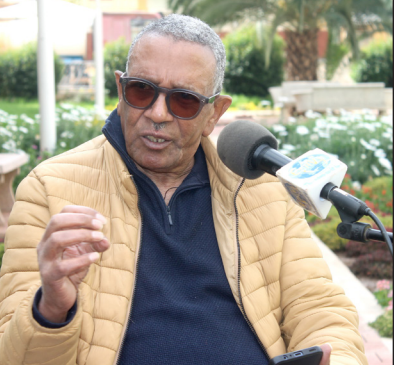
ናይ ብቐዳማት መመርመራ ምስ ናይ 7 ሃገራት ብምውድዳር ዝገለጸ ከይት ከምኣተረኽቦ ኣብረዉ።

ብወሳኝዎይ ዓቕሙ ሞራይ ዘይከብኩ ክኣሊታት ካብ ወጻኢ ብምምጻእ ስልጠናታት ክውድቡ ናውቲ ምርካኻ ንህቢ ብሰማይ ዋጋ ንኣረከቡት ክዕድል፡ ከምኣውን መመርመራብቐዳማት መመርመራብኩ ብምጽጋር፡ ብምጽጋር ደገፍ ክዘር ምጽኡ እዚ ደማ ኣብ ንግድታቶም ዓቢ ኣሰተዋጽኦ ከምዘለዎ ኣረጸኦ። ካብ ክሳድ ማይ-ጽገሕ ኢንጅነር መሓሪ ዝሰርሕሉ ብክምህርቲ ናብ ሃንጋሪ ኣብ ዝገቡ፡ ካብቲ ማእከር ሓገሮ ኣብ ዝኸደ መዓር ብዘተኸበረ