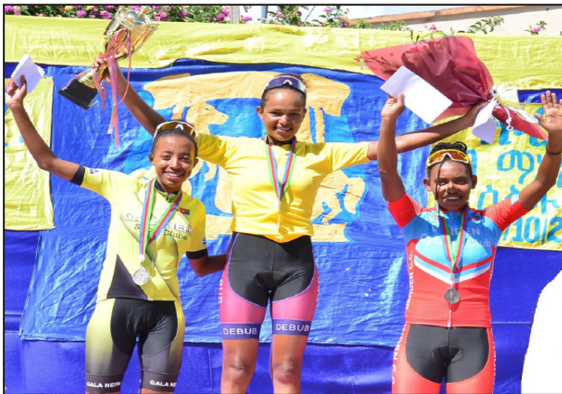
ዕዉት-ቲ ዙር ዞን ማእከል 2024 ሞናሊዛ፡ ድሕረኣ ምስ ዝወደኣ ብርኽቲን ሮምናን

ንምልዮ ኣገላለጽ ዓቕቤ ተቐዳዳምቲ ኣሰቤት ናታን መድረኻ ብ25 ዓመ. ወጪቱ፡ ዓወት ኣማን - ደንድን ብ22 ዓመ. ድሕሩ ወዳኢ፡ ብዞሊ ናታን ኣብ ሸውዓተ መድረኽ ገዝተሸጪን 826.4 ኪሎሜትር ብጠውሓዮ ማዕረ ብ21 ሰዓት፡ 5 ደቂቕን 24 ካልኢትን ብምውድኡ ዕዉት እዚ ዙር ብምድኡ ብጫ ማልዮ ለበሰዎ፡ ተቐዳዳምቲ ስምሃል ሄብሮን ብርጉ ብ3 ደቂቕን 22 ካልኢትን ካልኣይ ደረጃ ሓዘ።