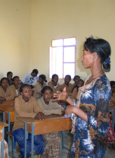
ሕያዎት ሓካይም፡ እመናን ዜጋታት ወዘተ. ኣብ ኣብያተ ትምህርቲ እዮም ዝዳለዉ።

ተመሃሮ ምስ መምህርን ኣብ ቤት ትምህርትን ዘሕልፎ ግዜ እቲ ዝውሓደ ምዃኑ ክንዝክር ኣሎና። ስድራቤት ልዕሊ ዝኾነ ኣካል ኣብ ልዕሊ ደቃ ስልጣን ዘለዎ ምዃና ክትፈልጥ ኣለዎ። ስድራቤት እታ ቀዳመይቲ መምህርን ቤት ትምህርትን ስለ ዝኾነት ስድራቤታት ብዛዕባ ብቐጥታን ብዘተዘዋዋርን ንደቀን ዝህብእ ትምህርቲ ዕቲብ ገምጋም ክገብራ ኣለወን። መምህርን ቤት ትምህርትን ኣብቲ ዝተሞህበም ዓይነት ተመሃራይ እዮም ዝሰርሑ። ኣብ ቤቱ ስነ ስርዓት ዘይተማህረ ተመሃራይ ኣብ ቀጽሪ ቤት ትምህርቲ ሰራሕ ተመሃራይ ክኸውን ትጽብዮ ኣይኮነን። ስነ ስርዓት መሰረት ኣካዳምያዊ ዕብዮት ወይ ብልጸት ስለ ዝኾነ ወለዲ ዝዘ መሰረትዚ ኣብ ምንጻፍ ከይተሓለሉን ዓቢ ግምት ሂደት ክዓይሉ ኣለዎም።