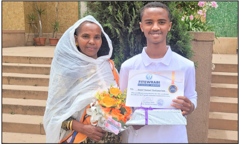
ወ/ሮ ብርክቲ ምስ ተማሃራይ የሴቶ

ወር ማርታ አምወን ኣብ ጀራል 96.4% ነጠ. ብምህታን ስልጠና ልተወራሪ ዝበተረት ጸላ ተማሪት ኣልፍና ንኸከኣ ኣብቲ ኣጋሞሪ ዝርከቡና እዩ። ጎሳ "እዚ ዝሃለ ስልጠና ልተወራሪ ብክፍሉ ናሪ ጸላ ናይ ደቃና ስለ ዝከት ብሮይኤ መክን ተሓክሲን እዩ ዘኸት" ደኅሪ ምዃኑ ጎሳ ኣብ ትምህርታ ንኸክፍብ ዘይጸፍ እናቐረብ፡ ኣብ ዝ ግዚ ብዘበደ ክክፍብ ክክፍብ እናተከተሉ፡ ጸላ ስራት ዝ እናውሓደን ኮምዚክሶ ትምህርታ ክክፍብ፡ ኮምዚክሶ ምዃኑ ስልጠና ግራዲ ዝህበ ስለ ዝከት ንወላዲ፡ ናይዚ ስልጠና አመጠና፡ ጸላ ተማሪት ኣልፍና ብርክቲ ብመኡ ደቡ ወላዲ ከይተሰለፉ ዝከላይ መጽናዕቲ ብምክራት ቦት ጎሳ ብምክራት ናይ ጀራል ስታት ትምህርቲ ኣብ ዝ ደማ ናይ መጽናዕቲ ግዚ ብምክራት ኣብ ራታና ክከውን ህ. ስልጠና ክክፍብን ኮምዚክሶ ተረጸ። ክኣት ተማሪውን ተሰምዖ ከይቀረኡ ክክሰቲ ኣክክሰሩ።