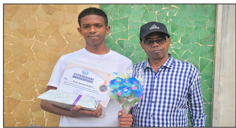
ሚጅር ተሰፋ-ዝጊ ምስ ተማሃራይ ህይብ

“ደቃና ኮምዚክሶ ምዃኑ ወጽኢት አምራሽ ክኸምን ንክፍ ክክከሰከን ምክኣልና ናይ ብተሳይ ተሓክሲን ዘኸት” ዝበከ ደሚ ኣብ መክራን ጎሳኸን ሓይታን ምዃቱን ምክኣልኡ ሓጺ ልዕሊ ስርገት ማር ተሰምዖን ሃይቶ (ሆሮሚን) ጎሳ። ማር ተሰምዖን ንወላዲ ተማሪይ ሃይብ ናቕሞ ዘክቅዶ ምኅ-ብህን ቦት ትምህርቲ እናሰርገን ምኅትታልን ስለ ዝከላይ ለሚ ወጽኢት ደኅምና ክክፍብ ምክቡ ኮምዚክሶ ጎሳ። ኣብ ጀራል 97% አምራሽ ተሰምዖን ዘሎ ወዳ ተማሪይ ሃይብ ተሰምዖን ደሚ ህ. ስልጠና ክከውት ዝክኣሉ ኣብ ርኢት ዝበረረ ምኅትታይ ምኅ ምርክብን መጽናዕቲን ብምዃኑ ምዚኡም ብዘኣ እናመሓደሩ ብክፍሉ ስለዘክፍብ ቦት ጎሳ ስለ ዝከፍን ኣበዚ ደጃ ኮምዚክሶ ጎሳ። ኣብ ቀላ ብምክራት ኣገጽጽጽ ኮምራቅ ጸውታ ክከውት ስለ ዝከውት ከዳ ብኣ ኣብ ዝሃለ ክክራት ደላ፡ ምዃኑውን ሓብሩ።