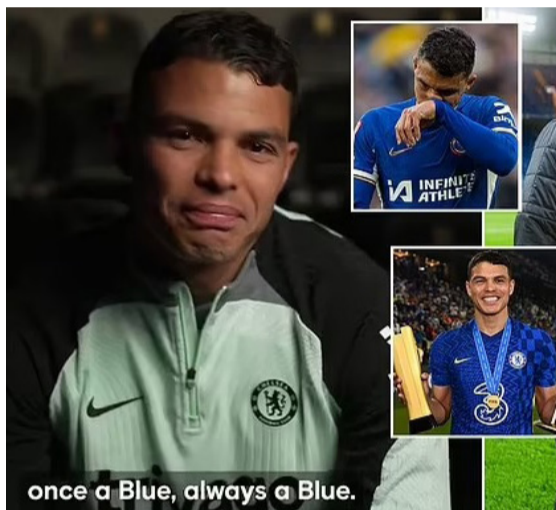
once a Blue, always a Blue.

ፍራንኮ ላምፓርድ እንከሉ ናብዛ ገጻም ዝተጸገሞ ሲልቫ፡ ኣብ ትሕቲ፡