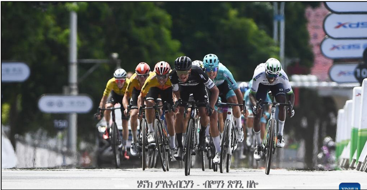
ሄናክ ምላሽ ሰጥቶ - ብሮን ጸግሮ ዘሎ

ደህረው ገዢው ገደል አብ ገዢው ቅጽበታዊ ውድድር ደም ከሌሎች አለፈ ተም መደሉን - የልማር ፓረዲክ ፕላንም ረብው ስንገዳ ረገዱ ካልሳይ ደረጃ ሲሆኑ።