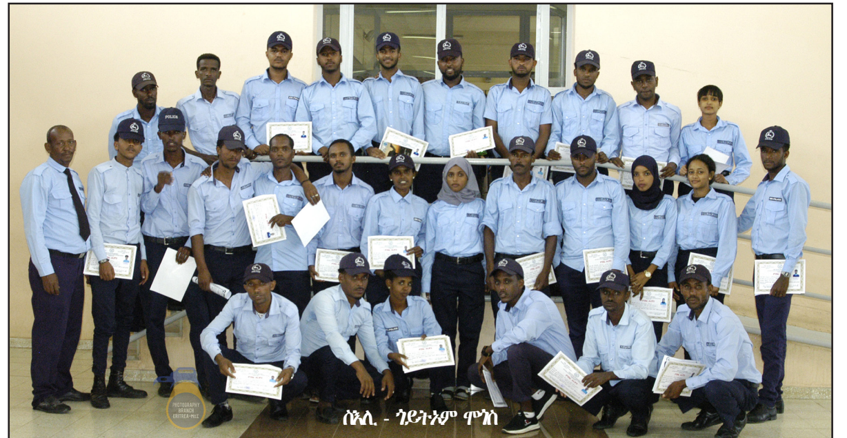
ሰይጣን - ገይትም ሞገስ

ኣብ ሀገርታል ከረን ዝርከቡ ሞያውያን እውን ዝተገለጹ መደብቲ ብጠቓሕ ዘይምስጥታት፡ 'ኣሰራርሓ' ዘሉ እናበልኩ ብኣደ ወገን ምቁራጽ ኣብ ምምስራቕ ዝውደቡት ገደባት ኮሚሽን ገለጹ። ኣገልግሎት መደብቲ ዞባ ዓንሰባ ን37 ትላላት ጥላላ ኣገልግሎት ዝሰጠን ዝኮተልን ኣካል ጨንፈር ማኅበረ ጥላላ እዩ።