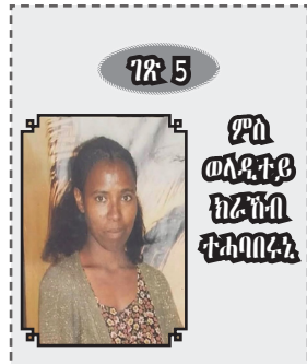
ገጽ 5 ዎስ ወለደቱ ክረግሰ ቁጠራ