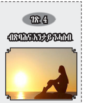
ገጽ 4 ብጽሐና እንታይ ንኤሰስ