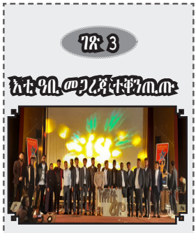
ገጽ 3 አቴዎስ መግለጫ ተክሎ