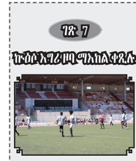
ገጽ 7 ከግብርና ጋር ግንኙነት