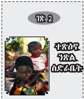
ገጽ 2 ተጽዕኖ ገጽ ሰድራሳት